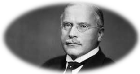
Carl Gustav Jung